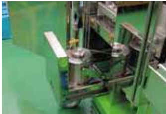
放射性藥品原液置於防護鎊罐

UG-05 實現藥品分注與投藥全自動化，精確作業並大幅節省人力。設備內建鎊罐以及鉛製屏蔽總計 80mm，最高可處理 37GBq 高活度藥劑。即便於最大活度下持續 8 小時，累計輻射僅 4 \mu Sv，單次分注投藥輻射洩漏僅 0.25 \mu Sv。另外整合不斷電備援系統，即便電力中斷，防護與精準分注依然持續，確保醫護人員在任何極端環境下，皆享有極低輻射暴露的安全職場。