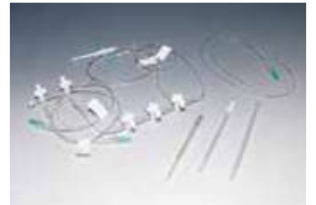
高經濟效益一次性耗材