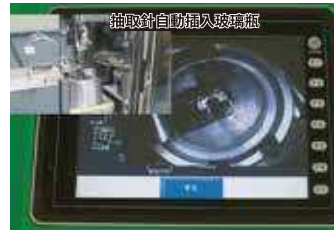
即時操作畫面顯示